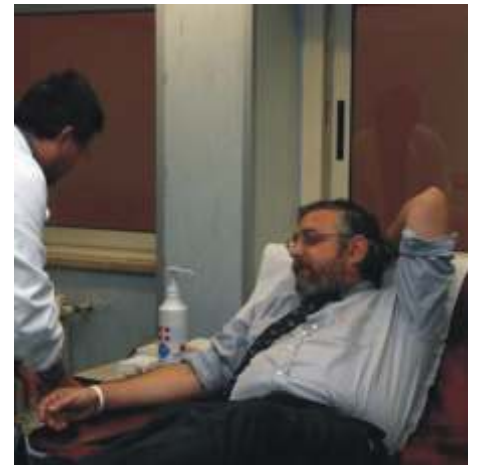
Adesione del Sindaco di Terni Paolo Raffaelli alla campagna di sensibilizzazione per la donazione del sangue

In Umbria sono circa trecento i donatori di sangue della Croce Rossa. In queste settimane si stanno svolgendo, in diversi Comuni, dei corsi di formazione e attività di sensibilizzazione per ampliare la platea dei donatori.