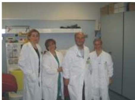
Lo Staff del Centro Trasfusionale

Inoltre, va considerato l'aspetto riabilitativo fisico, psicologico, familiare e sociale.