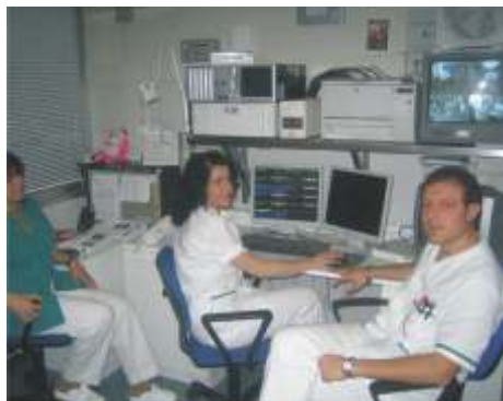
Centro operativo UTIC

Per tale motivo abbiamo ricevuto riconoscimento da tutta la comunità cardiologica nazionale e personalmente sono stato invitato a tenere una relazione a Firenze, nell'ambito del Congresso Nazionale dell'Associazione Medici Cardiologi Ospedalieri".