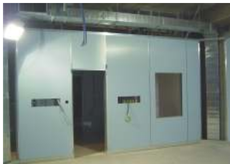
Nuovo blocco operatorio

I locali e i servizi ad esso connessi si trovano nel livello del secondo piano seminterrato comunicante con la già esistente radioterapia.