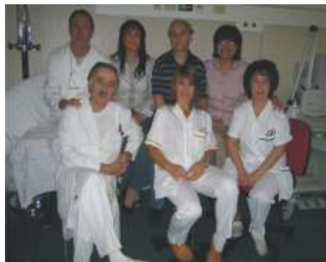
Personale tecnico della neurofisiopatologia

Il Servizio si trova al quarto piano (Segreteria tel 0744/205483)