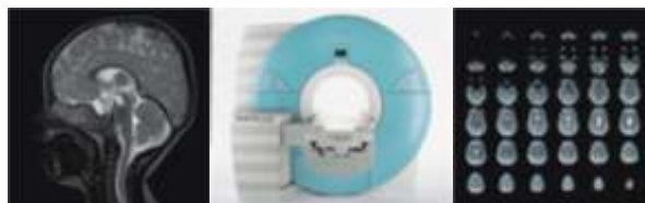
MAGNETOM Avanto un sistema Tim