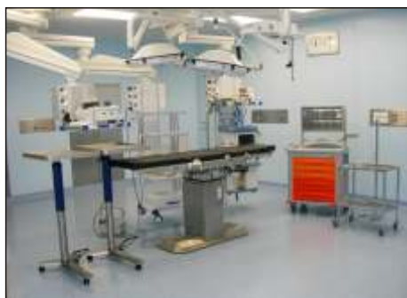
Sala Mininvasiva Maggiore