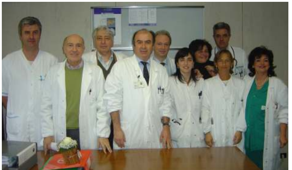
Lo Staff di Neurologia

noidea, procedure di accertamento della morte cerebrale con arresto del flusso ematico cerebrale. Il volume annuo di esami è di oltre 2300 tra ecodoppler dei tronchi sopraortici ed ecocolordoppler transcranici. L'ambulatorio di neurologia consente la rivalutazione clinica del paziente dopo la dimissione, un'osservazione longitudinale in caso di malattie croniche e un primo screening di pazienti inviati dal curante. L'attività è articolata in un ambulatorio generale (prima visita, controlli dei dimessi dal reparto e dei pazienti già valutati in pronto soccorso, programmazione di percorsi diagnostici neuroradiologici) e in tre ambulatori dedicati a settori specifici che attengono la neurosonologia, le cefalee e le demenze (Centro U.V.A.). L'ambulatorio è operativo durante tutti i giorni feriali e le prestazioni neurologiche vengono assicurate da tutti i sanitari della struttura complessa di neurologia per un totale di circa 3500 visite all'anno. La neurologia, insieme con la neurochirurgia, la neuroriabilitazione e la neurofisiopatologia costituiscono il Dipartimento di neuroscienze, di cui è direttore il dr. Giuseppe Neri.